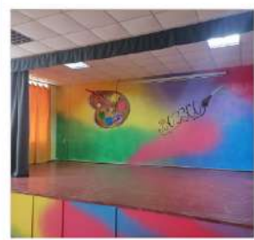
с. Велика Рублівка, Котелевський район

Оновлення актової зали Велико-рублівської ЗОШ 1-III ступенів