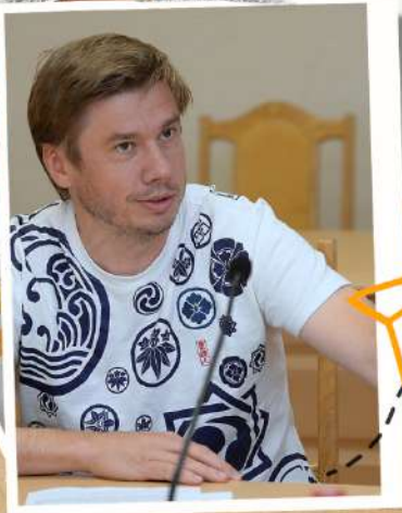
Олександр Біленький голова обласної ради

26% 0.645 Шкільний громадський Бюджет - дитячий варіант традиційного Бюджету участі, бо головні персонажі - діти. Вони активні, створюють цікаві ідеї для голосувань і, найголовніше, - якраз навколо дитячих ідей об'єднується вся спільнота. Цей проєкт дає можливість молоді, школярам отримати перемогу вже в невеличкому конкурсі свого міста, який називається «Шкільний громадський Бюджет».