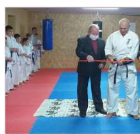
с. Сватки Гадацького району

«Цікавий світ східних єдиноборств Сватківського ЗЗСО 1-III ст. Гадацького району»